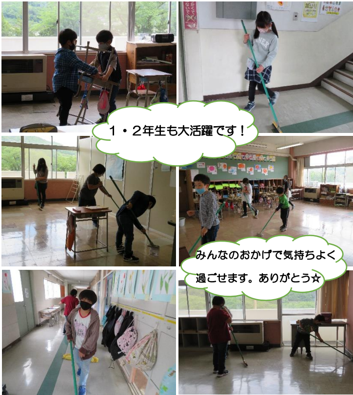
1・2年生も大活躍です!

ゴールデンウィーク明けの5月6日から、縦割り班による清掃を行っています。リーダーの6年生は、初めはドキドキした様子でしたが、班のメンバーを上手くまとめたり、1年生に優しく掃除の仕方を教えてくれたりしています。1年生も、お兄さんお姉さんのお話をよく聞いて一生懸命掃除を頑張っています! 2年生から5年生も、リーダーのサポートや1年生のお手本となるように頑張る姿がとても輝いています。