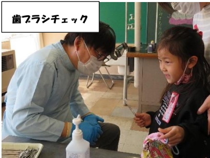
歯ブラシチェック

健康診断の結果を各家庭へ本日封筒に入れて配付しました。歯科検診結果は全員、視力検査結果は、今回の検査で視力がB(0.9~0.7)以下の子供たちが配付の対象となっています。検査結果を確認していただき、所見があった場合には病院受診をお願いいたします。